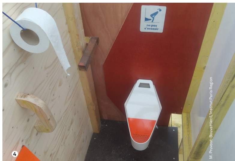
4. Urinoir féminin « Marcelle » permettant actuellement une récupération aux Grands-Voisins (Paris 14).