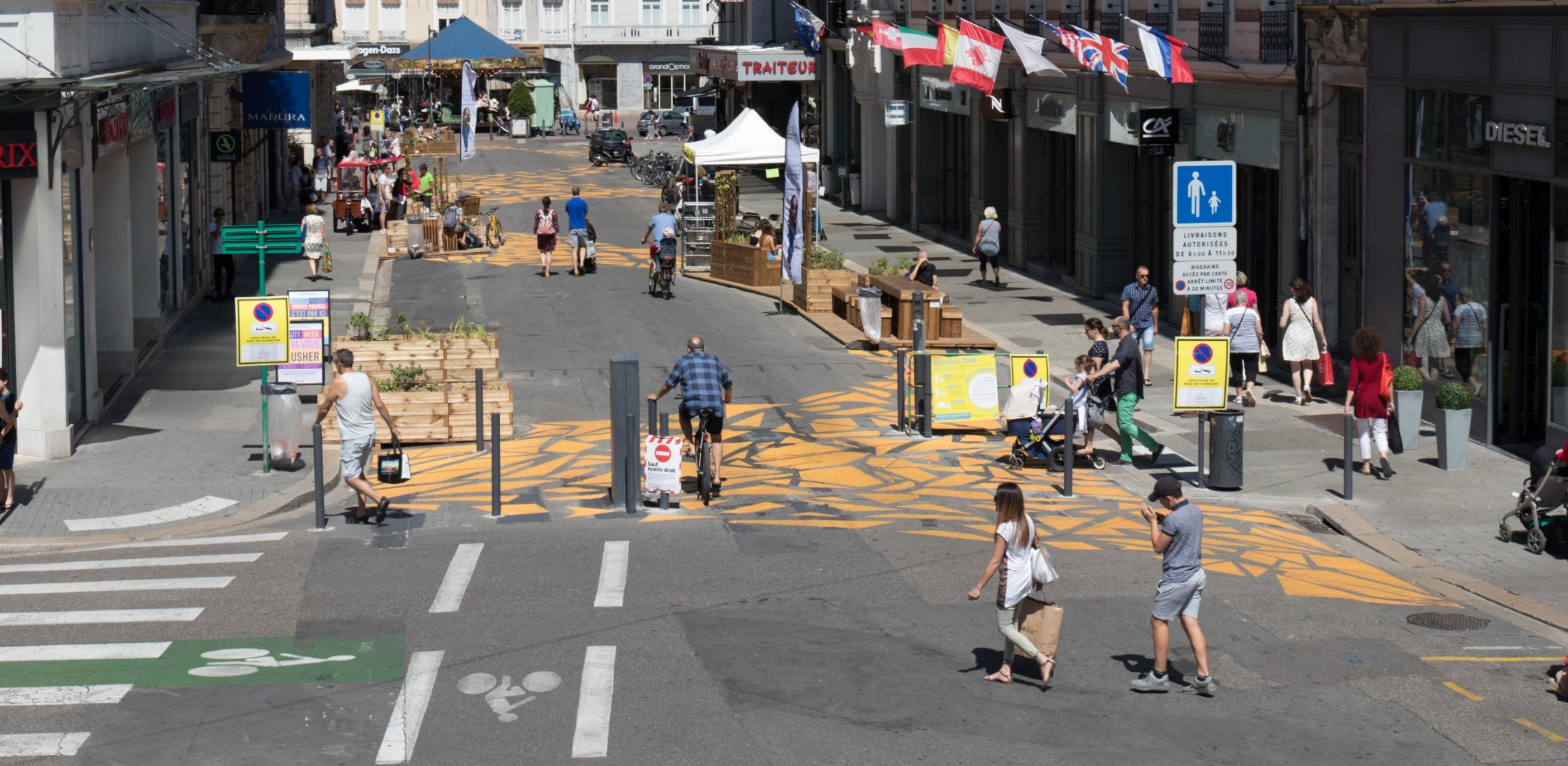
Piétonisation de la rue de la République pour le projet Cœur de Ville Cœur de Métropole