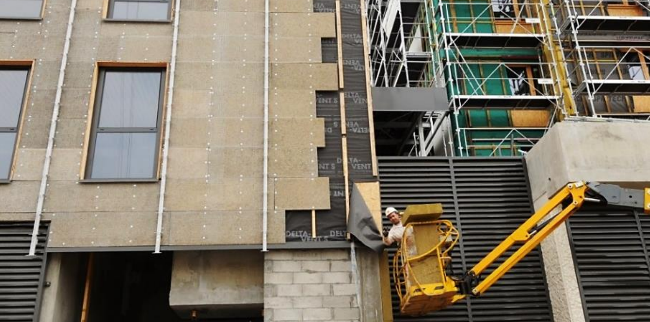
Travaux d'isolation thermique rue Marceau (ZAC de Bonne).