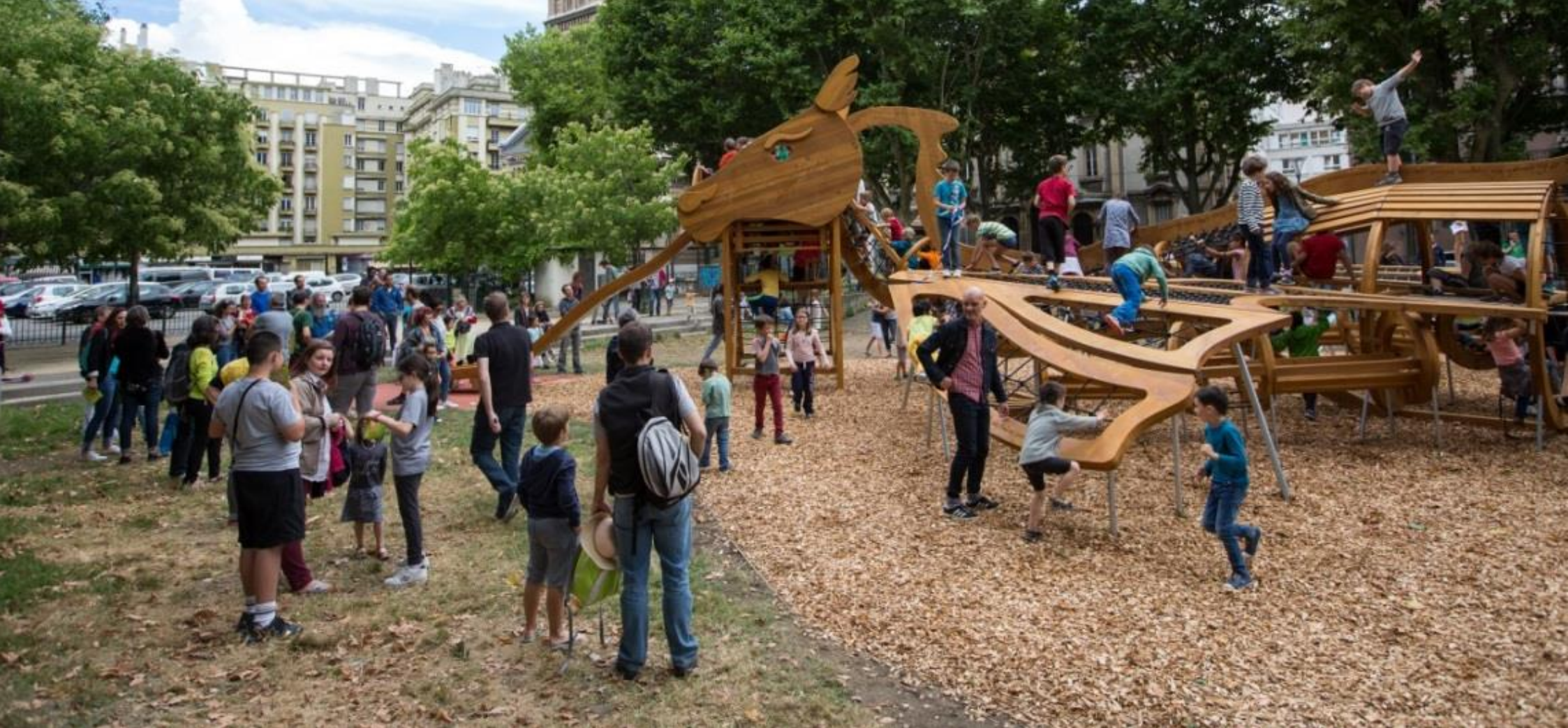
Inauguration de la « dragonne » place Saint-Bruno (juillet 2017)