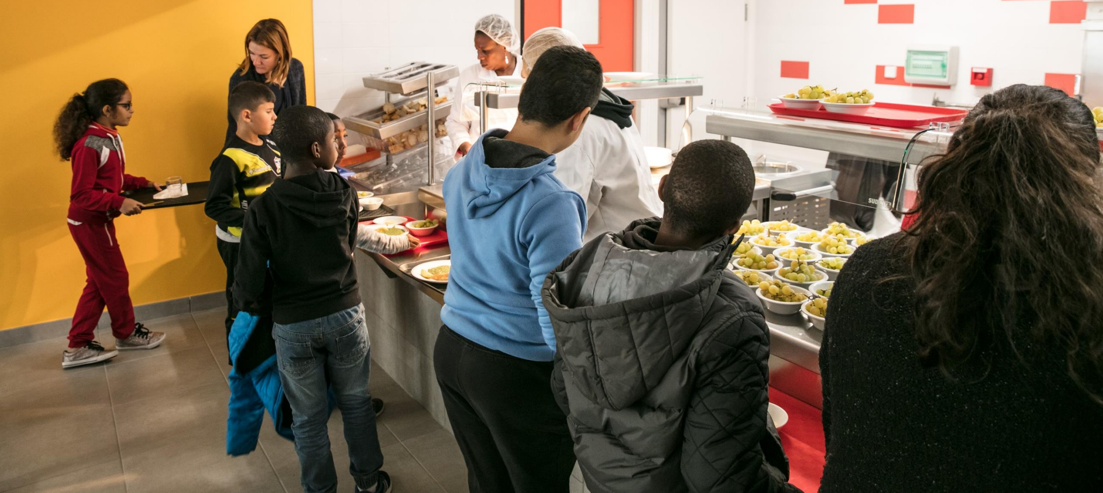
Distribution de repas au self scolaire Léon Jouhaux